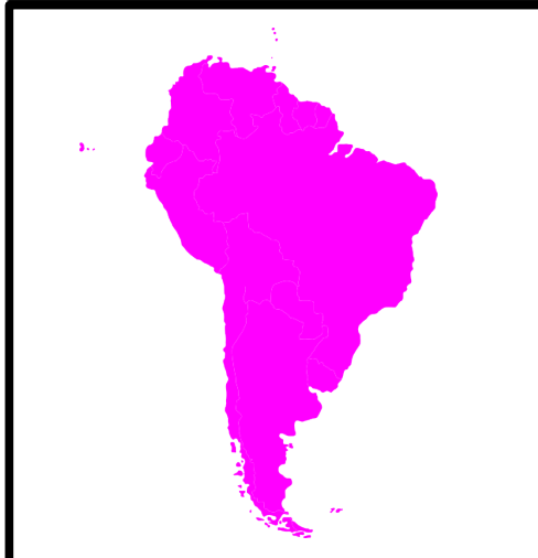
amérique du sud