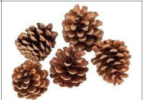
POMME DE PIN Pomme de pin