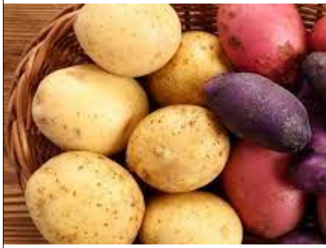
POMME DE TERRE Pomme de terre