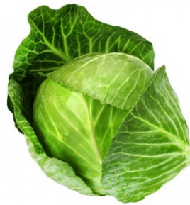
LE CHOU VERT