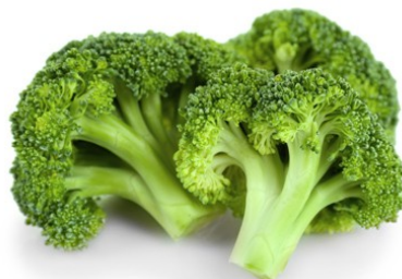
LE CHOU BROCOLI