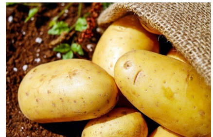
LA POMME DE TERRE