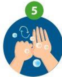
5 bases des pouces