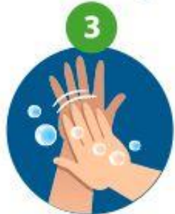
3 dos des mains