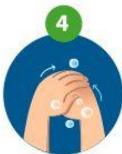
4 dessus des doigts