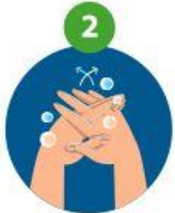
2 entre les doigts