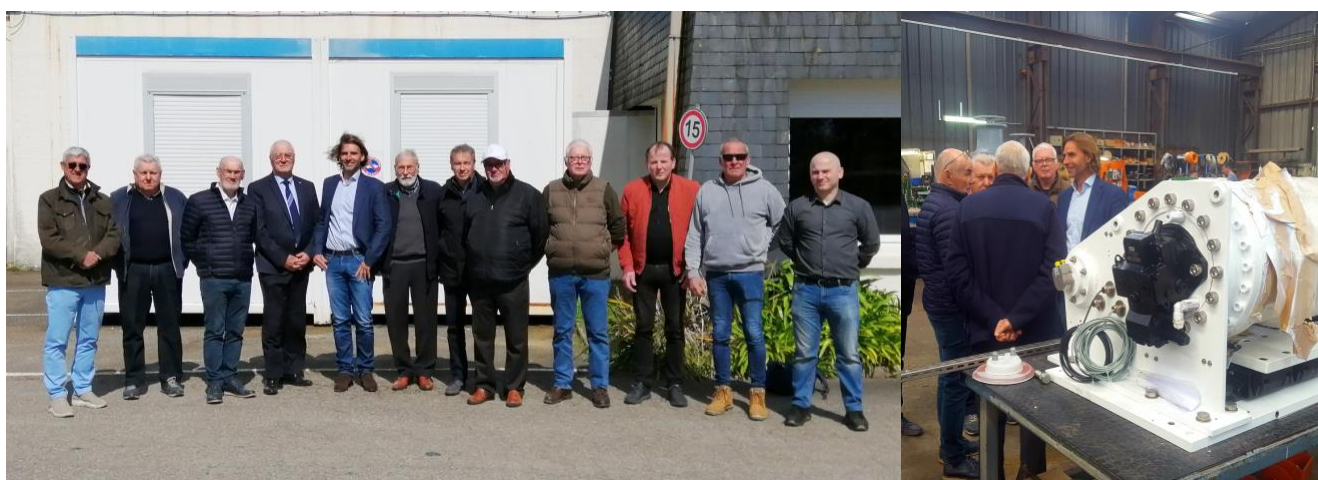
Visite de l'entreprise Bopp par une délégation de la section Finistère du Mérite Maritime.