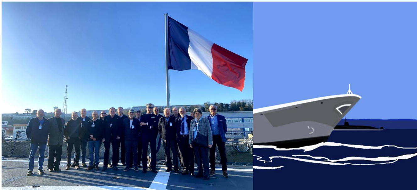
Dessin Eric Berthou : Visite de la FREMM Normandie à la base navale de Brest.