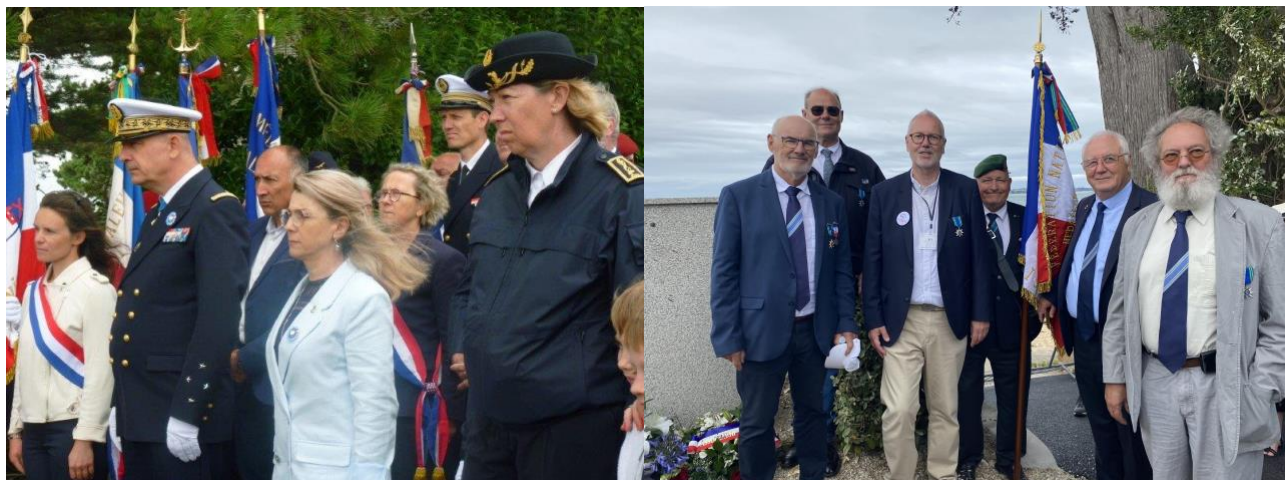
Commémoration du départ de 300 volontaires bretons de Carantec pour rejoindre les forces FFL.