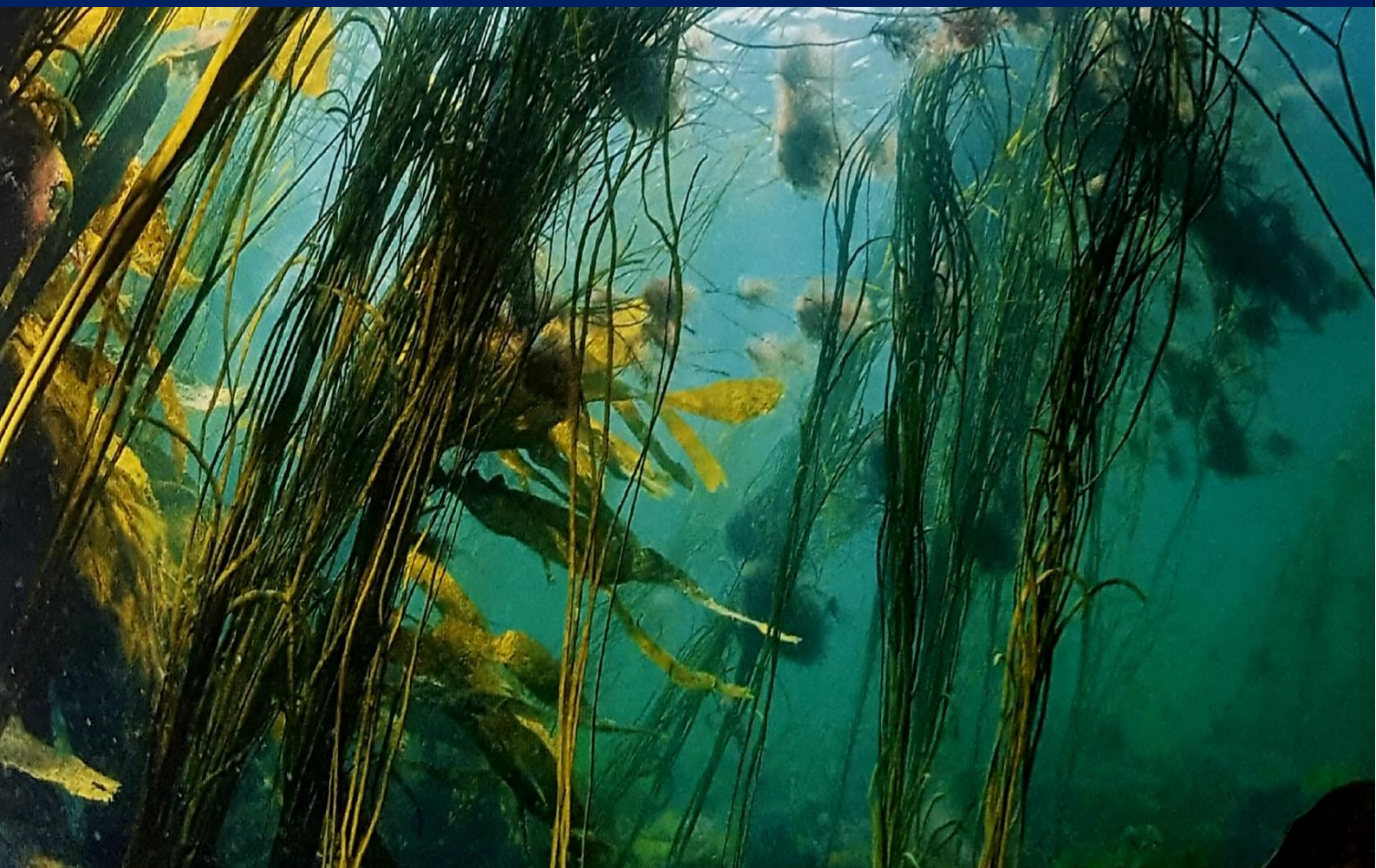
BZH20-La faune sous-marine en Bretagne : mer d'Iroise