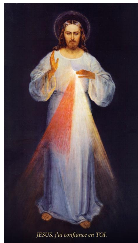
JESUS, j'ai confiance en TOI.

« Dieu saint, Dieu fort, Dieu éternel, prenez pitié de nous et du monde entier. » (× 3)