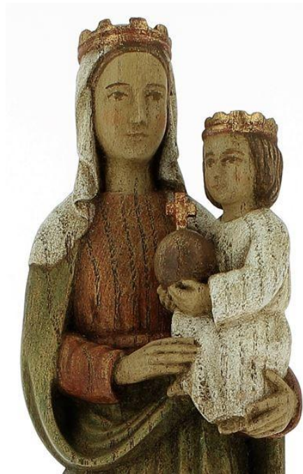
Vierge Reine – atelier d'art de Bethléem

Reine du Ciel, réjouissez-vous, alléluia car Celui que vous avez mérité de porter dans votre sein, alléluia est ressuscité comme Il l'a dit, alléluia Priez Dieu pour nous, alléluia.