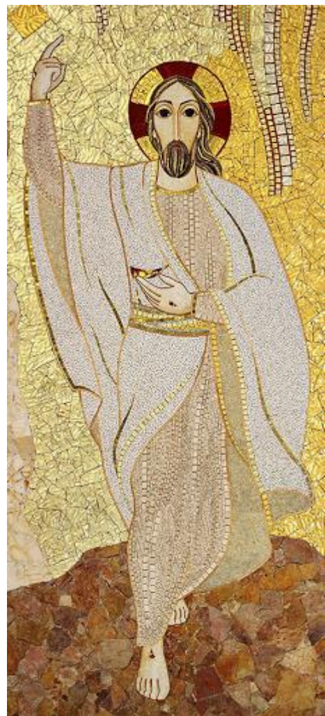
Résurrection - Rupnik

4. Amour infini de notre Père, Suprême témoignage de tendresse, Pour libérer l'esclave, tu as livré le Fils ! Bienheureuse faute de l'homme, Qui valut au monde en détresse Le seul Sauveur !