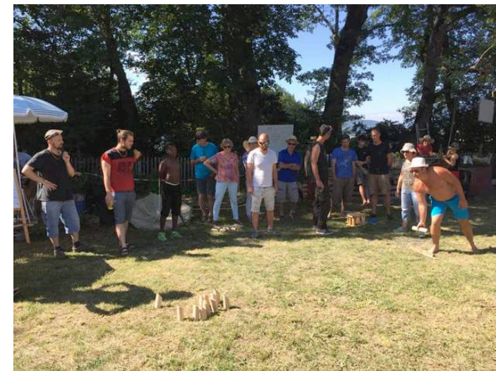
Tournai de molky juin 2017/ jardin partagé du Percy

Les personnes âgées qui auraient des difficultés pour porter leurs déchets peuvent contacter la mairie.