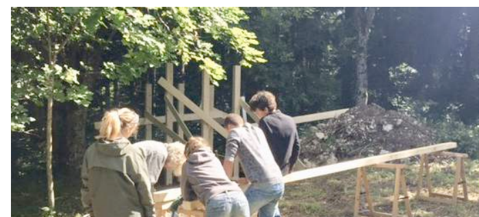
Chantier jeune à Esparron

(« Qui dirige le Monde ? » par la compagnie KaouKaFeLa – corde aérienne, théâtre, danse,...)