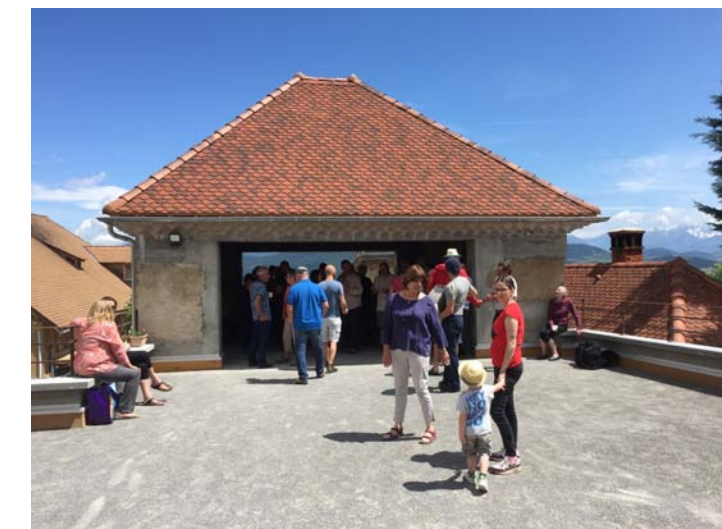
Apéro /pétanque juin 2016 organisé par CDF du Percy

Suite à la réunion publique du 26 mars dernier au sujet de l'acquisition de l'ancienne colonie de Fontaine et du projet de logements associés à de l'activité les démarches ont bien avancées. La commune du Percy a fait une proposition financière écrite à la commune de Fontaine (sur la base de l'estimation des Domaines). Cette proposition vient d'être validé à l'unanimité par le conseil municipal de Fontaine le 27 juin dernier. Les formalités vont être engagées pour finaliser et signer l'acte de vente . Une belle avancée après plus de 20 ans de négociation et un grand merci aux élus Fontainois. En parallèle nous travaillons avec les porteurs de projet pour pouvoir rapidement engager la suite.