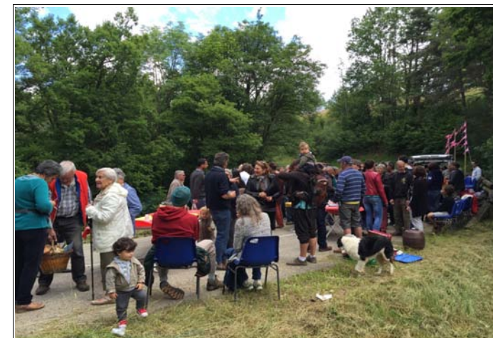
Fête du pont organisée par les CDF du Percy et Monestier du Percy 19/06

ou en contactant Josselin au 07 82 06 16 23.