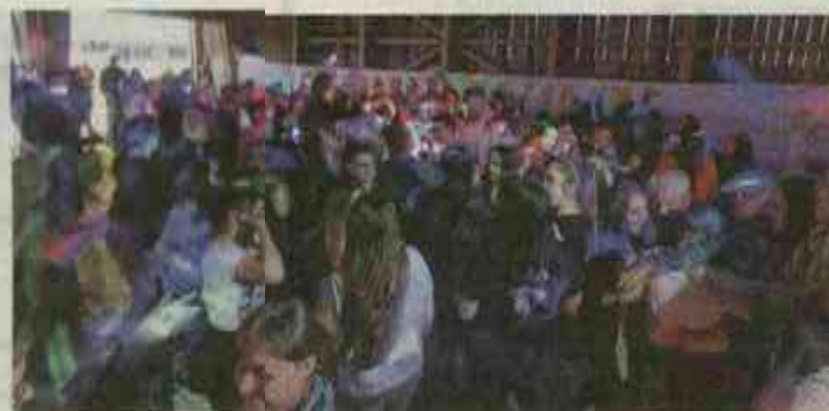
Quand la stabulation se transforme en discothèque, avec un super DJ !