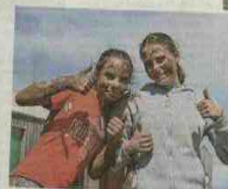
Une journée anniversaire... comme ça !