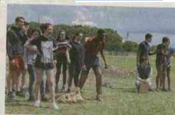
Des équipes soudées...