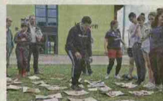
Jeu de mémoire, toujours ensemble et dans la gaieté !