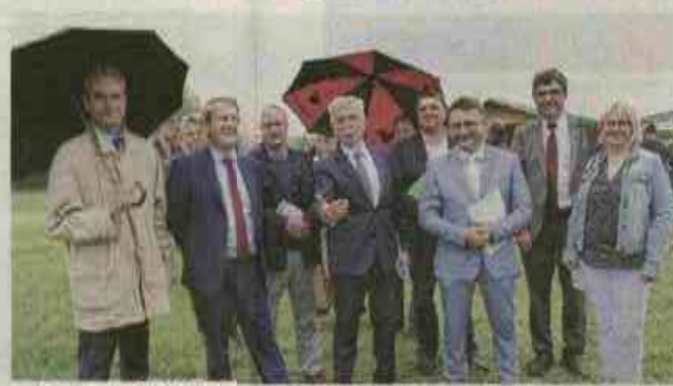
Les personnalités de la Région Centre-Val de Loire étaient présentes. L'enseignement agricole émane du ministre de l'Agriculture et le lycée du Conseil régional.