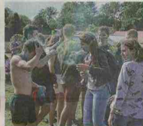
Un lancé de couleurs, symbole de l'ouverture et de la joie.