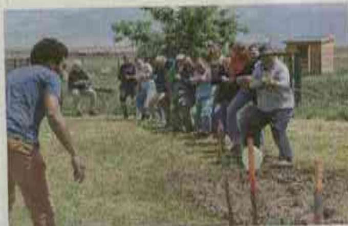
Les membres de l'association des anciens élèves (ADALAP 18), grands gagnants du tir à la corde face aux jeunes !