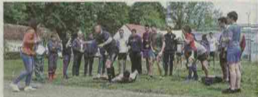
Un nombre de défis attendaient les élèves, qu'ils soient intellectuels ou sportifs. Mixtures éducatives !

"J'ai été lycéenne aux Giffois de la seconde au bac technico-agricole que j'ai obtenu en 1990. L'ambiance générale était plutôt familiale, les enseignants et les personnels prenant soin des élèves. Les classes étaient à l'effectif réduit ce qui facilitait l'apprentissage. Le lycée était et est toujours ouvert sur diverses horizons. Je me souviens particulièrement d'un voyage pédagogique en Allemagne dans un lycée viticole, c'était ma première sortie à l'étranger".