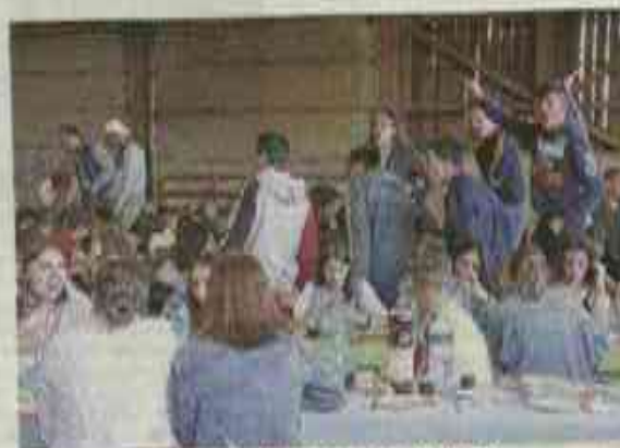
Joyeuse ambiance pendant le dîner !