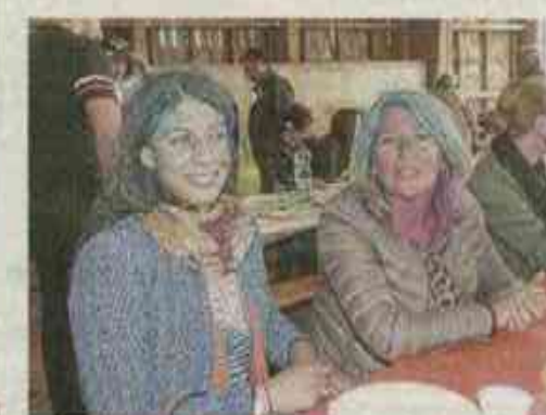
Les professeurs aussi ont largement participé !!!