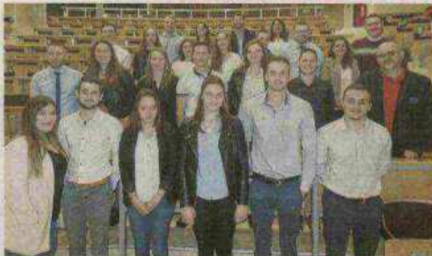
La classe de licence pro a fourni un lourd travail sur l'évolution de l'agriculture depuis la création de la PAC.

"Il y a cinquante ans, il fallait produire pour nourrir les hommes. Aujourd'hui, nous sommes autosuffisants. Il faut produire en tenant compte de l'économie, du technique, de la préservation de l'environnement et répondre à la demande sociétale de plus en plus forte" ont-ils avancé. Alors que l'agriculture vit une crise, comment redonner une image attractive au métier ? Des solutions existent, de nouvelles pratiques émergent, c'est ce qu'ont souhaité montrer les étudiants. Avoir une