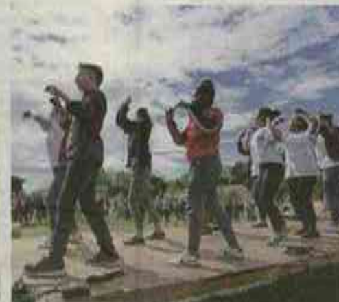
C'est succès pour la dynamique # attractive flashmob !