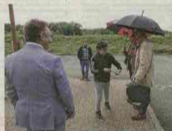
Certains élèves, de la 4e au BTS, avaient une mission propre à accomplir pour cette journée.