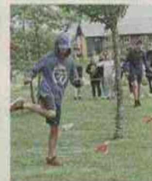
... pour encourager leurs camarades à l'aveugle ou dans la boue.