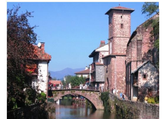
St Jean Pied de Port