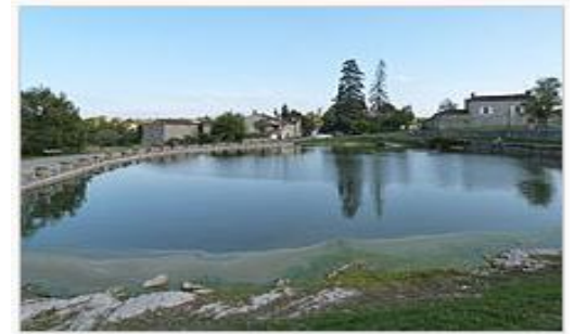
Le lac d'Aujols avec ses lavoirs « papillons »

Avant Lauzerte vous passerez tout prêt du village de Montcuq qui connu la célébrité dans les années 70 avec Daniel Prévost dans l'émission Le petit rapporteur !