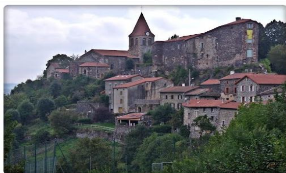
St Privat d'Allier