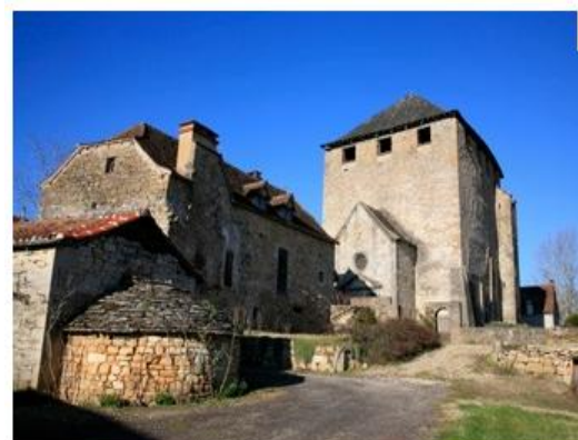
St Pierre Toinac