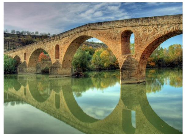
Puente la Reina