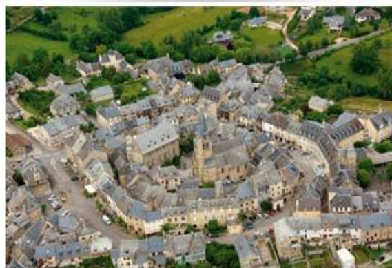
St Come d'Olt