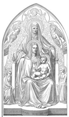
Nativité de Notre-Dame 8 septembre