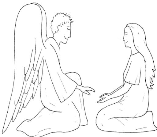
L'Annonciation Réalisation : Loïc G