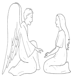
Réalisation : Loïc G