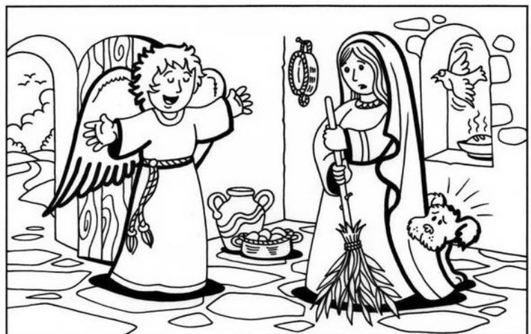
L'ange Gabriel annonce à Marie qu'elle aura un fils : Jésus, le fils de Dieu.

A toi de trouver les 10 différences entre les deux dessins.