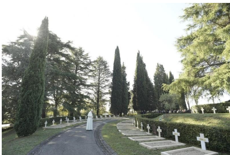
Cimetière militaire français de Rome, 2 nov. 2021

« Inconnu Mort pour la France » : le pape François a parcouru les tombes des soldats français débarqués en Italie et morts lors des batailles pour libérer Rome, l'Italie et la France lors de la seconde guerre mondiale, ce mardi 2 novembre 2021, au cimetière militaire français de Rome. Ces tombes, a affirmé le pape, un masque de douleur sur le visage, « crient la paix ». Car la guerre « mange les enfants de la patrie ». Il a interrogé: « Combattons-nous suffisamment pour qu'il n'y ait pas de guerres ? »