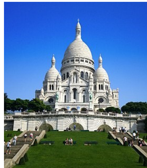
Sacré Cœur de Montmartre

Le programme est donné à titre indicatif et peut être modifié en fonction de la disponibilité des lieux, des intervenants ou d'événements non prévisibles par l'organisateur.