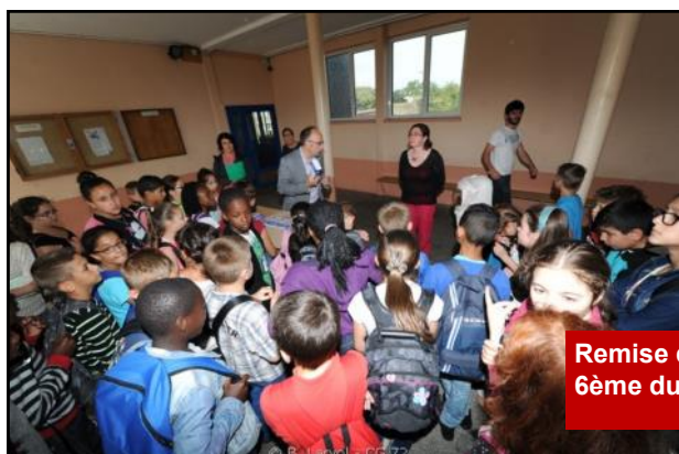
Remise des dictionnaires aux élèves de 6ème du Collège Le Ronceray.

Toutefois, des travaux restent programmés dans les autres établissements. Ainsi, au Budget 2015 15 000 € sont inscrits pour la rénovation des salles de classes du 2 ème étage du Collège Les Sources et 67 000 € pour des travaux de rénovation et de câblage au Collège Vauguyon.