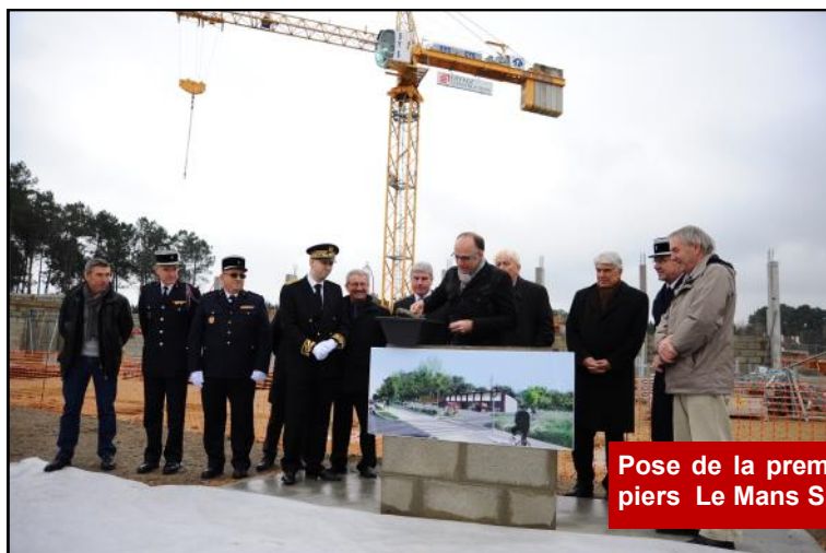
Pose de la première pierre de la caserne de pompiers Le Mans Sud Métropole (décembre 2014).

Enfin, le lancement de la construction de la Caserne de pompiers de Pontlieue sur la ZAC Fouillet permettra également de renforcer la tranquillité sur notre territoire en permettant une intervention plus rapide des pompiers sur le Sud de l'agglomération.