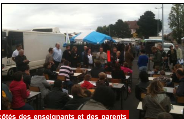
Aux côtés des enseignants et des parents d'élèves de la Cité des Pins pour empêcher la fermeture d'une classe (2011).