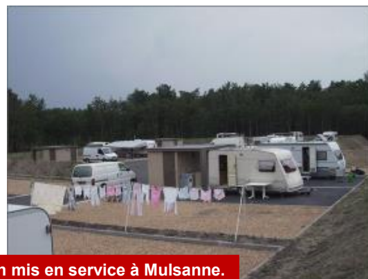
Le 1 er terrain mis en service à Mulsanne.

Sous ma présidence, le Syndicat Mixte de la Région mancelle pour le Stationnement des Gens du Voyage (SMGV) a poursuivi son action de gestion et d'entretien des 228 places de stationnement réparties en douze terrains. L'achèvement des travaux a permis la mise en œuvre, en lien avec les forces de police et de gendarmerie, d'une procédure unifiée de lutte contre le stationnement anarchique applicable à l'ensemble des communes comprises dans le périmètre du SMGV.