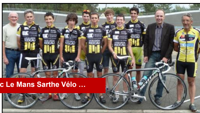
Avec Le Mans Sarthe Vélo ...