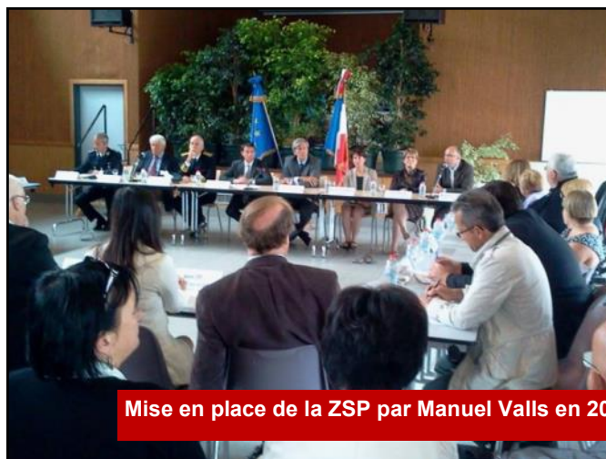
Mise en place de la ZSP par Manuel Valls en 2013.

Conformément à ma demande, le Conseil général s'est impliqué davantage sur les actions de prévention de la délinquance notamment en redéfinissant les missions du Service de Prévention Spécialisée de la Sauvegarde 72 qui intervient sur les quartiers Ronceray, Glonnières et Vauguyon.