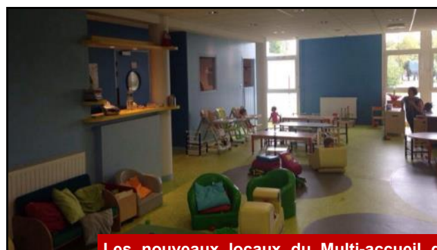
Les nouveaux locaux du Multi-accueil du Centre social des Quartiers Sud.

J'ai également apporté un soutien appuyé à l'association Arc-en-Ciel. Installée par mes soins dans une maison individuelle rue Edouard Belin, elle apporte un soutien important à des enfants malades et à leur famille. Une action en tout point exemplaire.