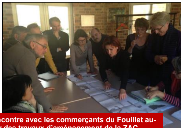
Rencontre avec les commerçants du Fouillet autour des travaux d'aménagement de la ZAC.