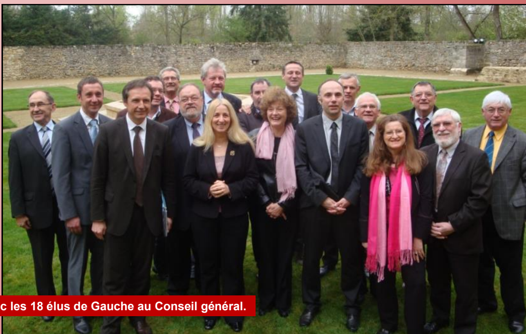
Avec les 18 élus de Gauche au Conseil général.

Cette fonction m'a permis de dépasser le strict cadre cantonal pour également mener un travail de réflexion et de propositions à mettre en œuvre à l'échelle du Département dans son ensemble.