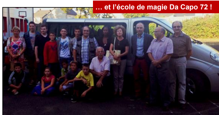
... et l'école de magie Da Capo 72 !