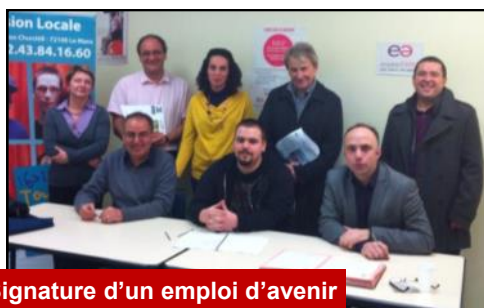
Signature d'un emploi d'avenir au titre du SMGV.

Je proposerai la création d'un « Contrat de soutien à l'autonomie des jeunes » qui permettra d'accompagner sur des objectifs définis conjointement les jeunes de 16 à 24 ans qui rencontrent des difficultés et manifestent la volonté d'avancer à travers un projet précis.