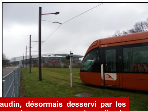
Ruaudin, désormais desservi par les transports en commun à partir du terminus du tramway à Antarès.