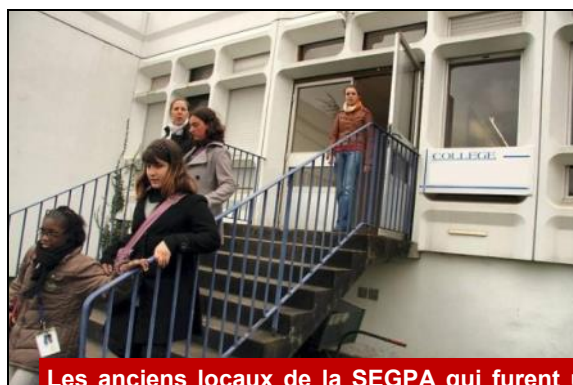
Les anciens locaux de la SEGPA qui furent un temps utilisés par le collège Val d'Huisne permettront la création d'un pôle scientifique au sein de l'établissement.

Plusieurs scénarii seront établis, plus ou moins ambitieux, en fonction des besoins de l'établissement et des crédits départementaux destinés aux opérations de cette envergure. Mais, un premier chiffrage laisse à penser qu'une enveloppe de 5 millions d'euros sera nécessaire.