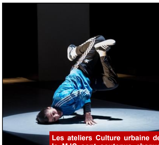
Les ateliers Culture urbaine de la MJC sont soutenus chaque année par le Conseil général.

J'ai tenté de m'opposer en vain au déménagement des antennes Glonnières et Vauguyon du Service social départemental sur le secteur du Panorama. Si les agents y ont gagné en qualité de travail, ce déménagement a conduit à éloigner les services des habitants.