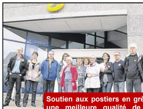
Soutien aux postiers en grève pour une meilleure qualité de service dans les Quartiers Sud (2012).