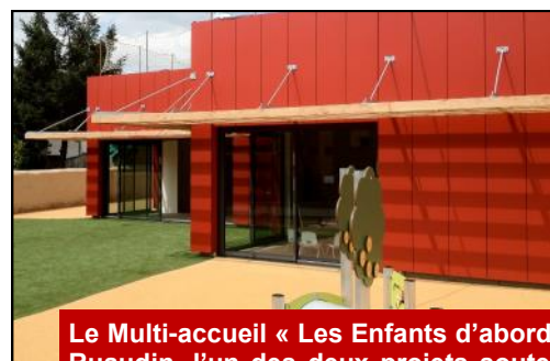
Le Multi-accueil « Les Enfants d'abord » à Ruaudin, l'un des deux projets soutenus par le Conseil général.

Pour être complet, il convient également de prendre en compte les travaux de modernisation du Circuit des 24 heures sur lequel le Conseil général a investi 4,5 millions d'€uros sur la durée du mandat.