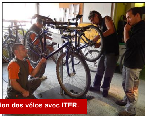
Activité d'entretien des vélos avec ITER.