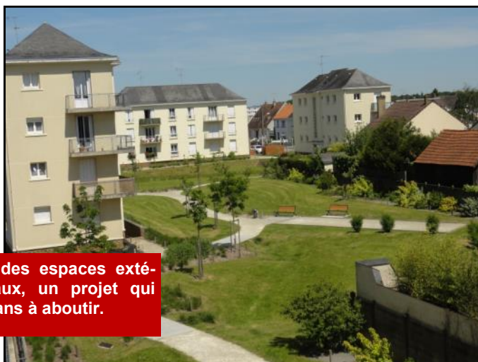
Le réaménagement des espaces extérieurs des Bigarreux, un projet qui aura mis plus de 15 ans à aboutir.

Mes interventions auprès de Le Mans Métropole et Sarthe Habitat ont permis de débloquer le dossier de rénovation des espaces extérieurs de la Cité des Bigarreux dont les travaux se sont achevés en 2014.