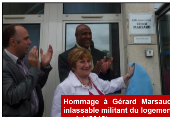
Hommage à Gérard Marsaud, inlassable militant du logement social (2012).