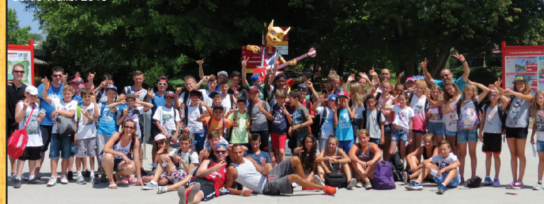
Sortie Walibi 2015