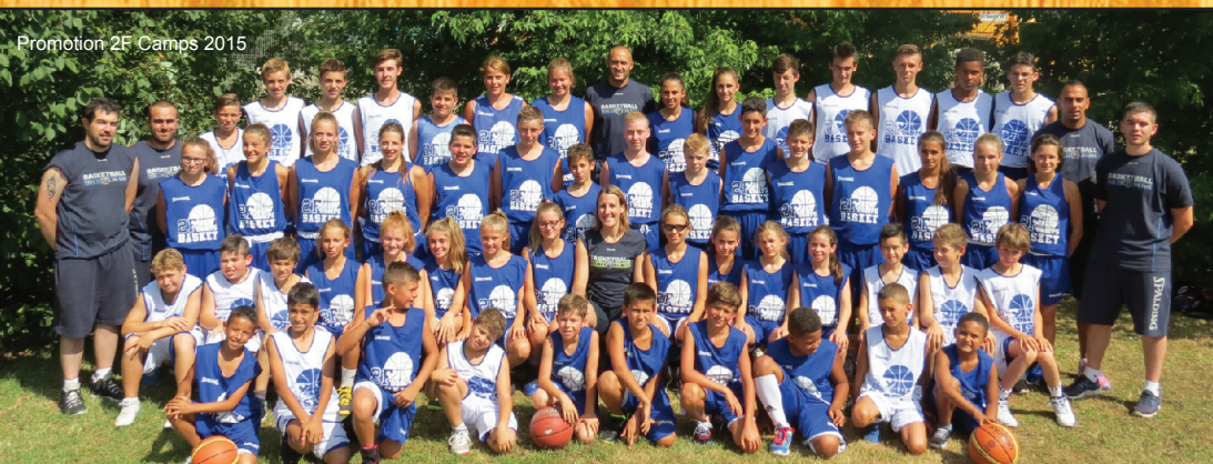
Promotion 2F Camps 2015