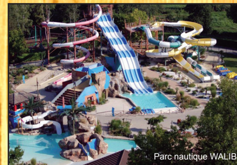
Parc nautique WALIBI