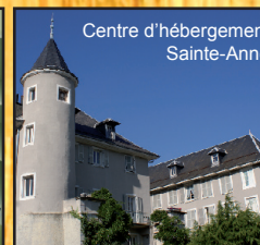
Centre d'hébergement Sainte-Anne