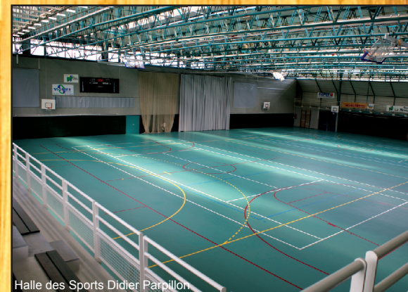
Halle des Sports Didier Parpillon