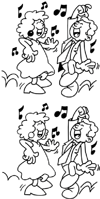
Jeu des 7 erreurs

Une vie sans amour, c'est une année sans été. - proverbe suédois