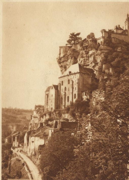
Chemins de fer du P. O.

Service Maritime Postal Franco-Bresil-Uruguay-Argentine