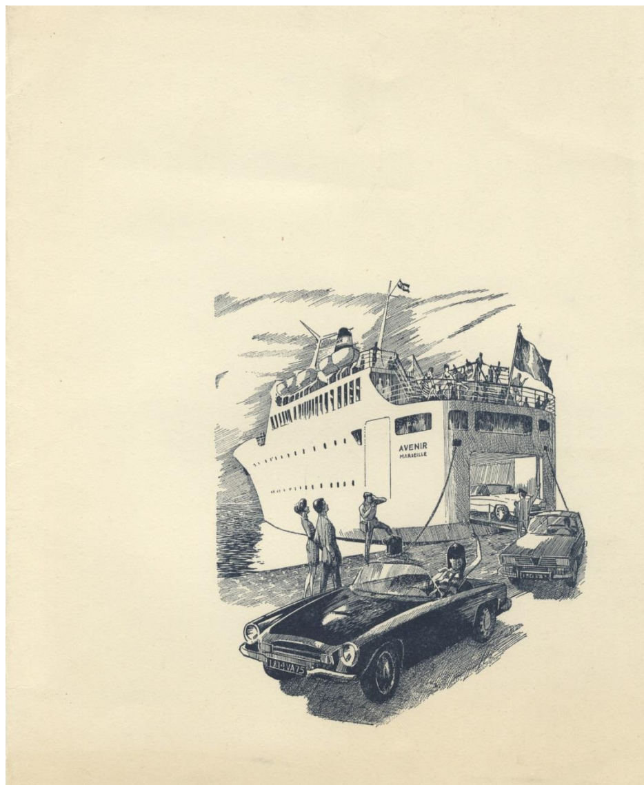
Couverture commune aux trois menus