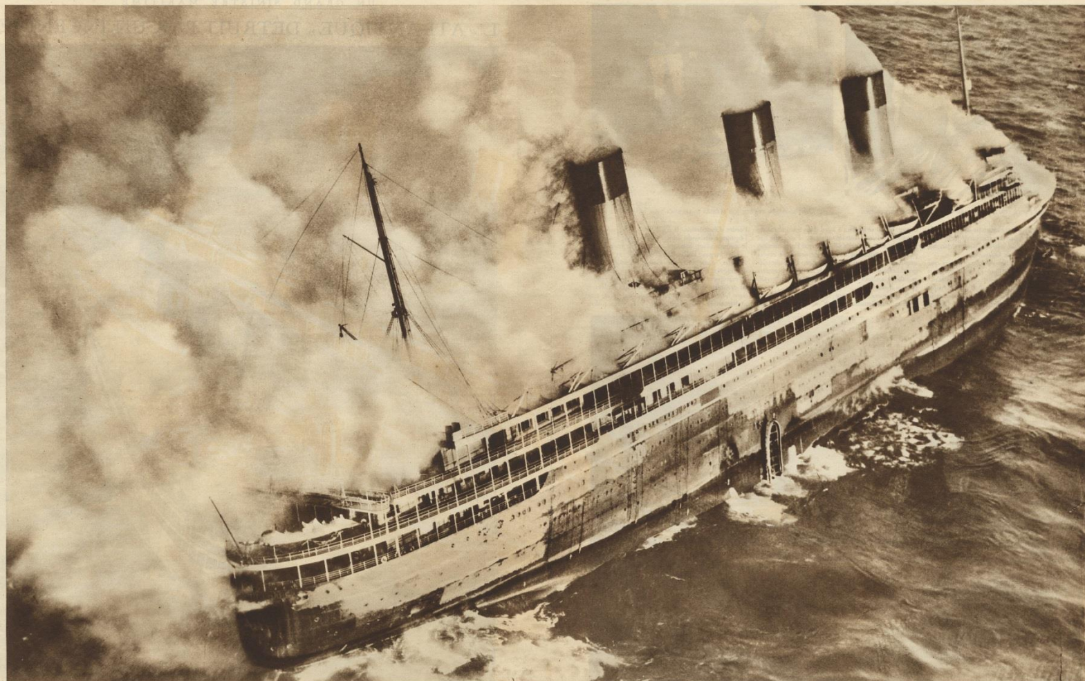
LE TERRIFIANT SPECTACLE OFFERT PAR L'INCENDIE DU PLUS RÉCENT ET PLUS LUXUEUX PAQUEBOT DE LA COMPAGNIE SUD-ATLANTIQUE, PHOTOGRAPHÉ D'AVION