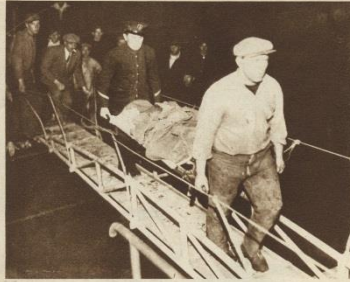
UN BLESSÉ PORTÉ SUR UN BRANCARD EST DESCENDU À CHERBOURG