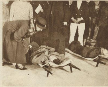
ON S'EMPRESSE AUTOUR DES BLESSÉS DÉBARQUÉS DE L'« ACHILLES »

Le plus somptueux ambassadeur de luxe et de goût que la France ait jamais dépêché vers l'Amérique du Sud a brûlé dans la Manche, au large de la petite île de Guernesey. L' Atlantique , le paquebot de 41 200 tonnes que la Compagnie Sud-Atlantique et les Chargeurs Réunis lancèrent en 1910, avait quitté Bordeaux mardi, et se rendait au Havre, où il devait entrer en cale sèche. A 1 h. 30 du matin, le mercredi, alors que le navire se trouvait entre Brest et Cher-