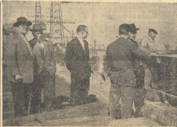
Les seuls témoins de cet historique instant furent quelques techniciens de diverses activités maritimes. Sur cette photo, les ingénieurs des Chantiers de l'Atlantique-Penhoët et de la Compagnie Générale Transatlantique surveillent l'opération.