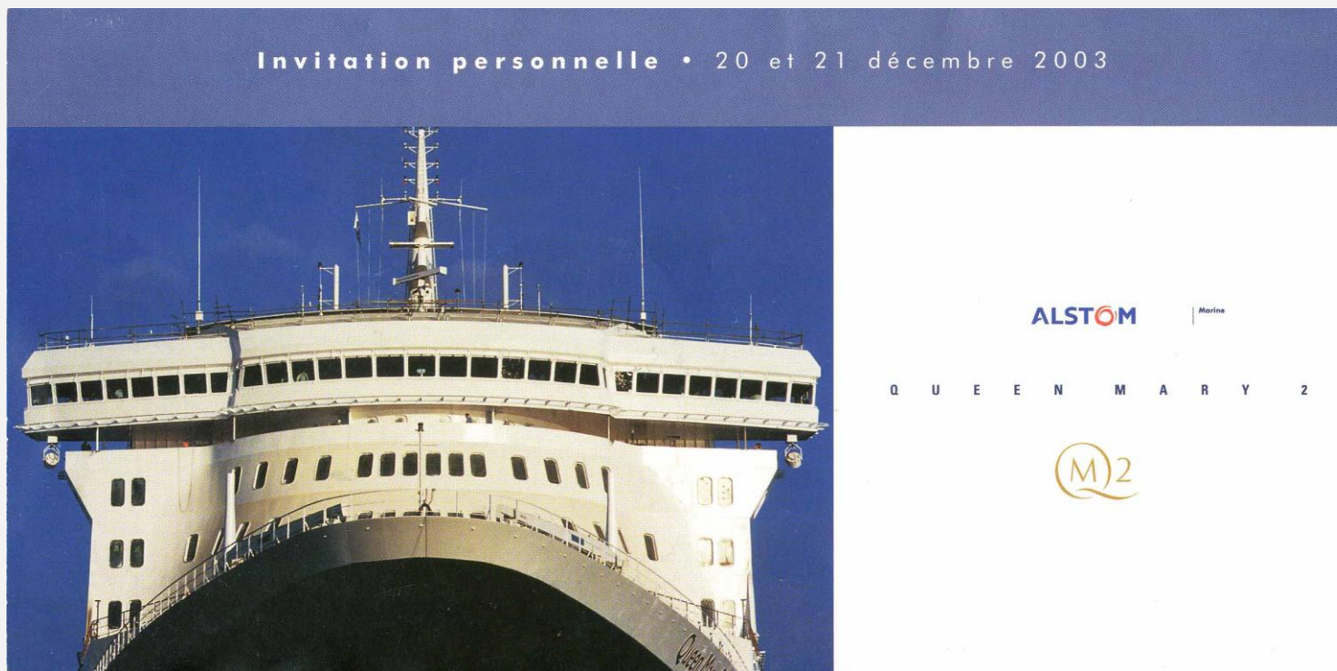
Couverture / Cover

Invitation pour une visite du QM2, le 20 décembre 2003/ Invitation for a QM2 tour on December 20th, 2003