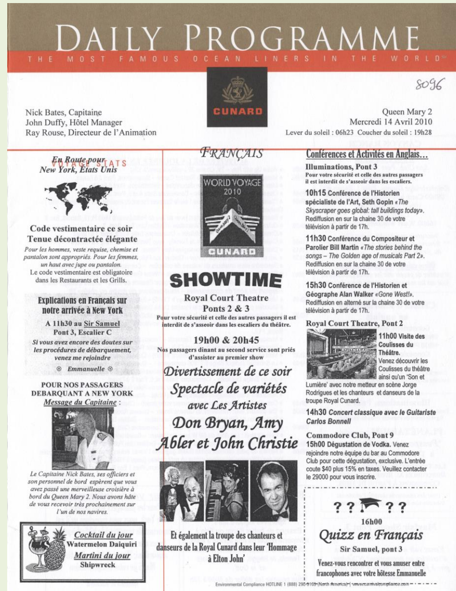
Couverture du programme