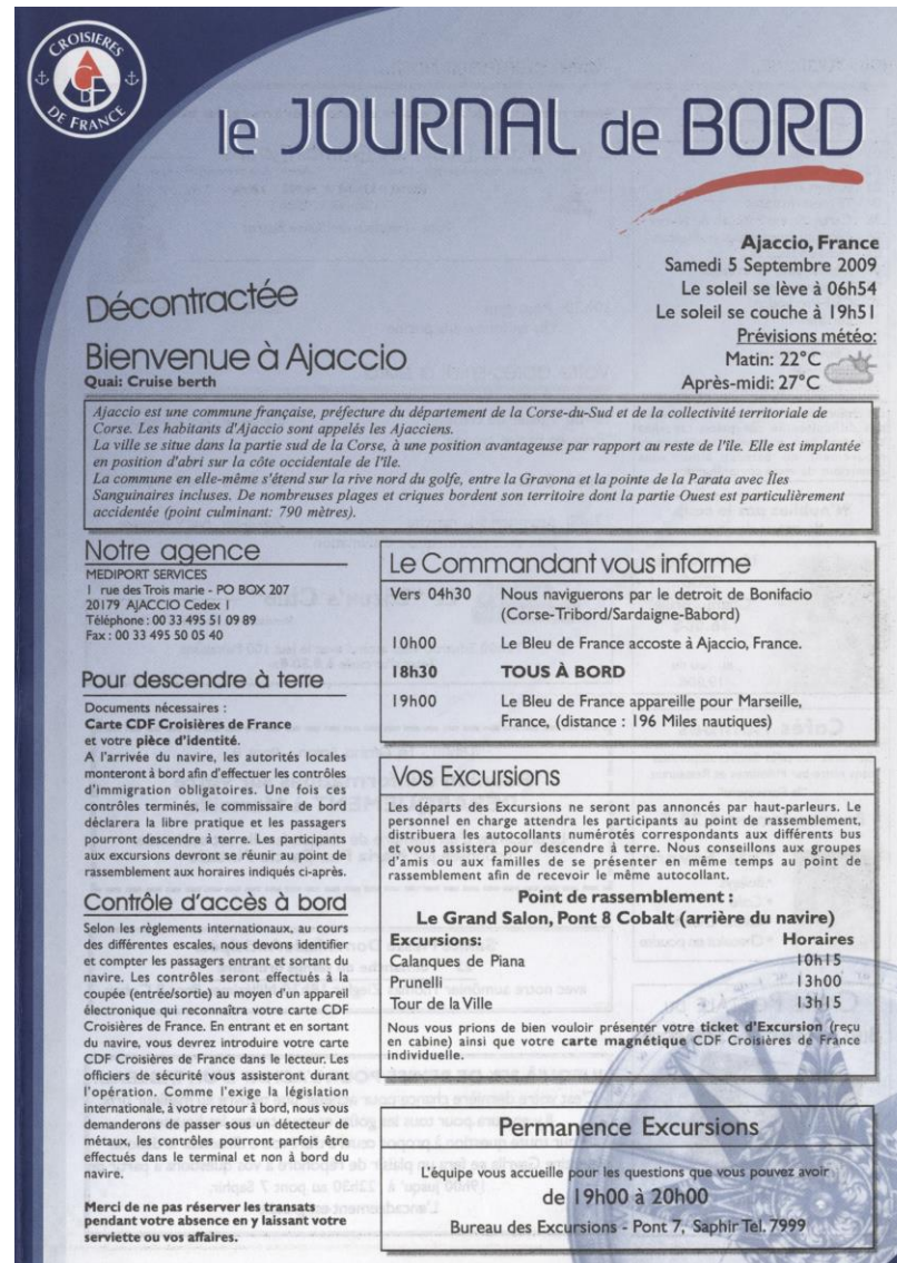
Couverture du Journal de Bord