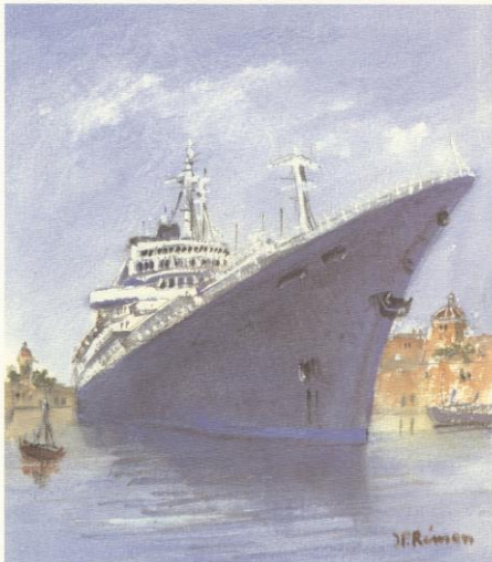
Le Géant des Mers parmi les Hommes Escadre maritime

Sancerre « la Moussière » 2000 Domaine Alphonse MELLOTT