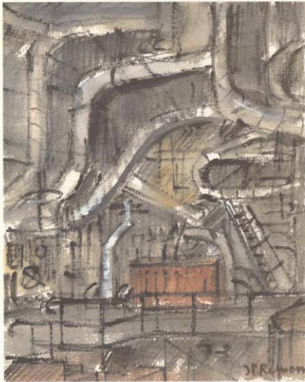
La Salle des Machines - Vignis surveillés -

Champagne « Brut Réserve » BILLECART-SALMON