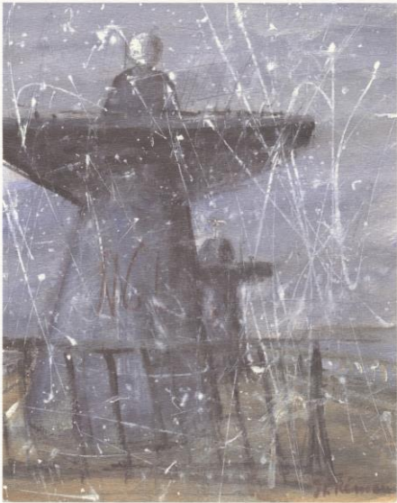
Les Cheminées en Fête "Que la fête demeure..."

Chablis 1 er cru « Forêts » 1999 Domaine MOREAU-NAUDET