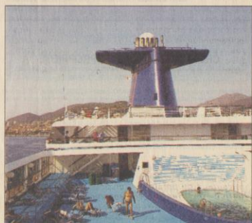
Le sundeck, le pont le plus haut du bateau avec piscine et jacuzzi. Sous les cheminées mythiques du paquebot repeintes en bleu, les croisiéristes ont pu admirer la Cité impériale.