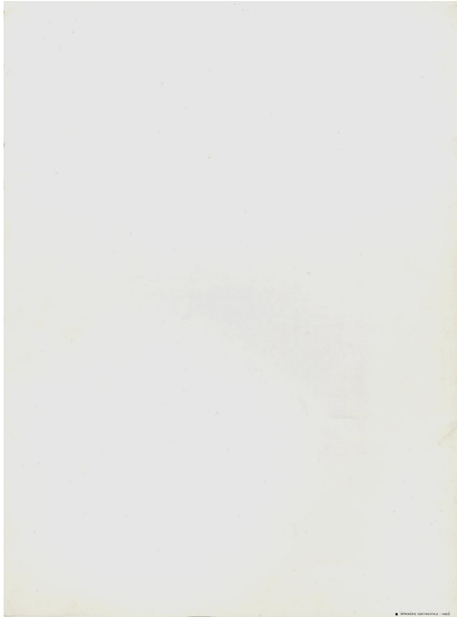
Dos de la plaquette