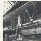
L'arbre central tribord à la sortie de l'atelier distributeur.