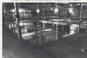
La salle à manger de la classe touristique s'étendra sur deux étages.