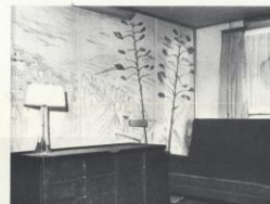
Un coin d'une cabine modèle de première classe.