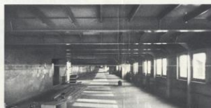
Le pont promenade de la classe touristique.