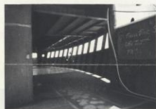
La timonerie. C'est de là qu'en Octobre 1961, le Commandant Croisille donna le signal du premier départ.

sur le sundeck, on trouvera le chemin et de grands espaces pour les jeux de plein air.