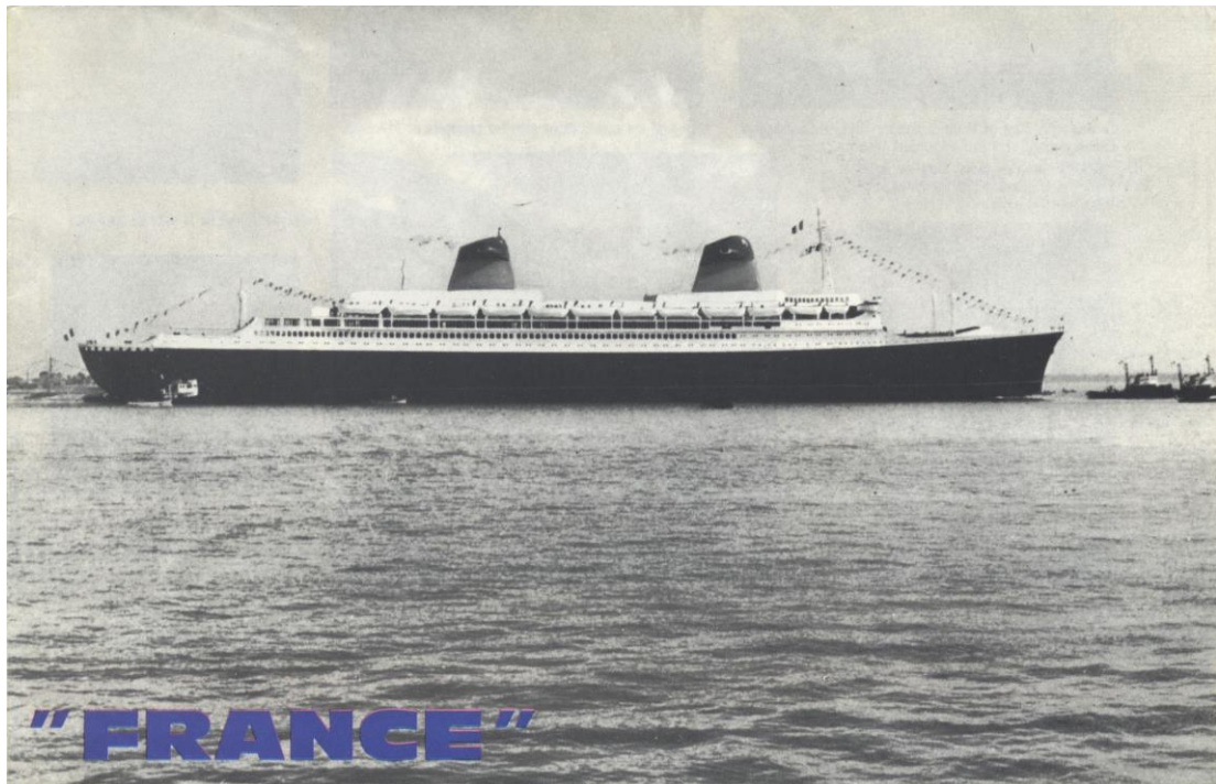
Couverture du dépliant