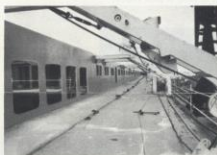
Le pont des embarcations pour les passagers de 1 re classe