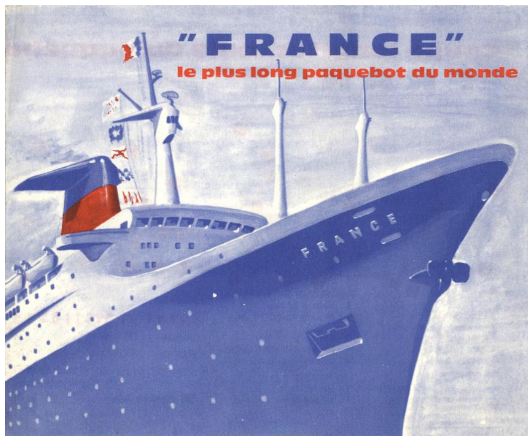
Couverture du dépliant