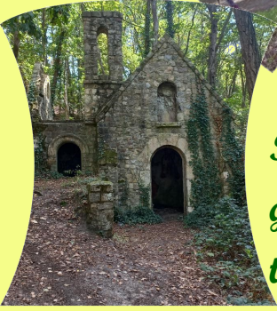
La Chapelle Des Luères

Très belle rando du côté de Moncé-en-Belin, dans ses bois et ses grandes allées, avec un beau soleil, et 56 amis heureux de se retrouver, pour discuter et surtout pour rire !!!