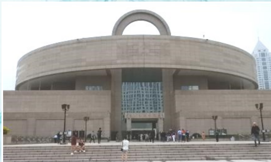
Visite du Musée d'Art et d'Histoire.