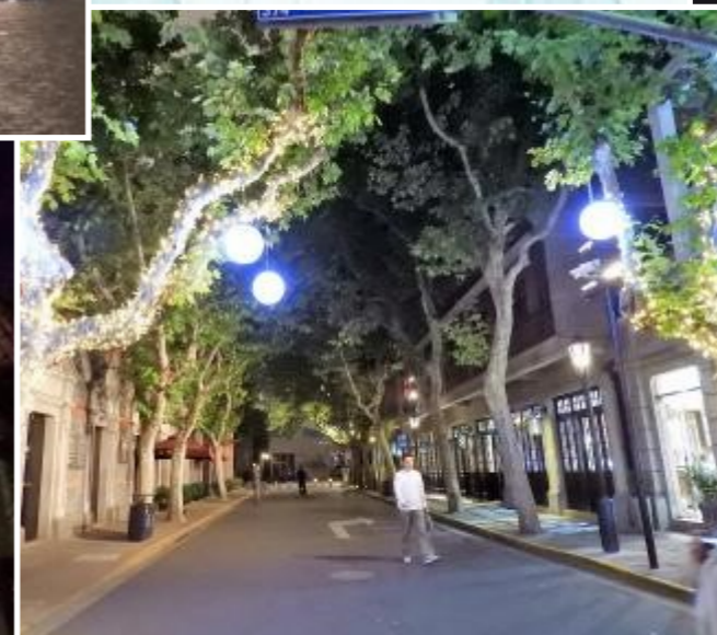
Ou dans l'ancienne concession française.