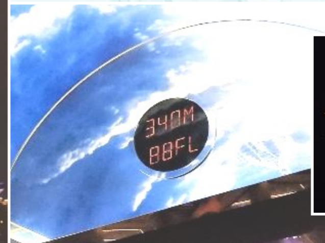
Escapade au 88 ème étage.