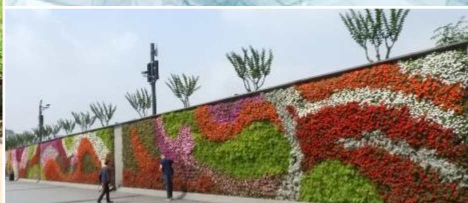
Et voilà le voyage se termine.