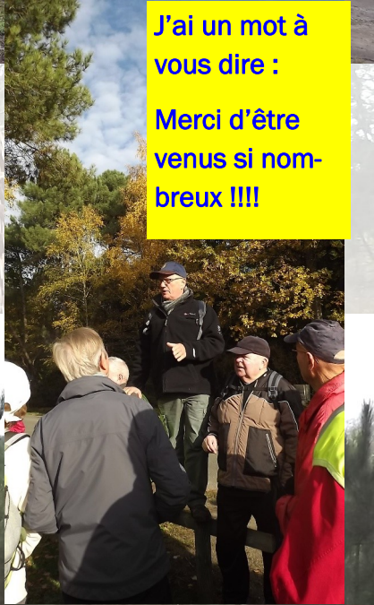
Oiié !!!!! Quel bonheur de se retrouver tous ensemble !!!!