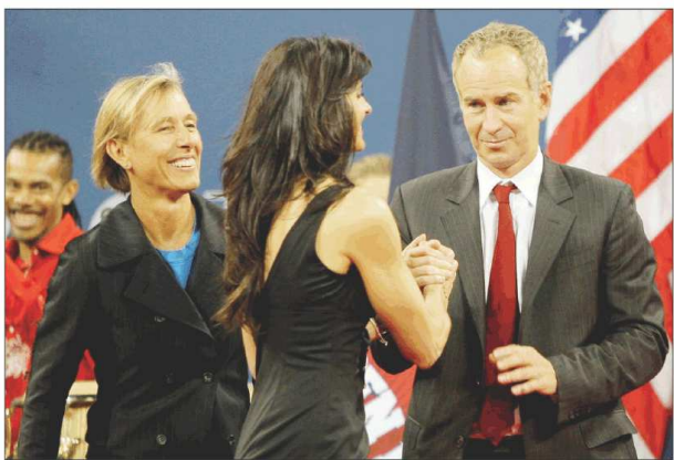
NEW YORK Au jeu des rencontres, les «anciens» Martina Navratilova, Gabriela Sabatini et John McEnroe échangent quelques regards de qualité.