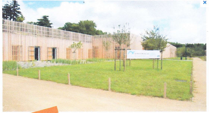
Maison du LAC

Randonnée/visite autour du Lac de GRAND-LIEU et de sa maison du Lac