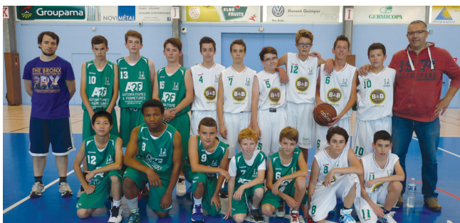
Les équipes U15 2 et 3.

Les catégories U 9 et U 15 sont les plus représentées.