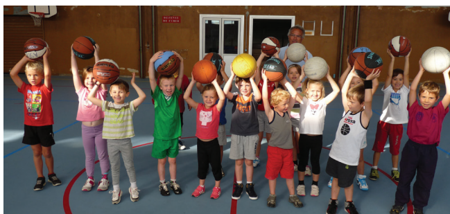
La section baby-basket

Tous les samedis au gymnase du lycée Thépot de 10h45 à 12h00.