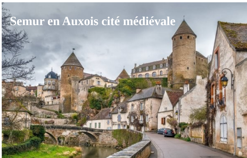
Semur en Auxois cité médiévale