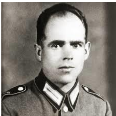
Franz Jägerstätter (1907-1943)

"Peut-on servir en même temps le Christ et satan ? " D'où cette question que Franz pose à son évêque : "qui peut être en même temps soldat du Christ et soldat du national-socialisme ? Qui peut combattre en même temps pour la victoire du Christ et de son Eglise et pour celle d'Hitler ? " (dont le projet est d'éradiquer l'Eglise dès après la guerre).