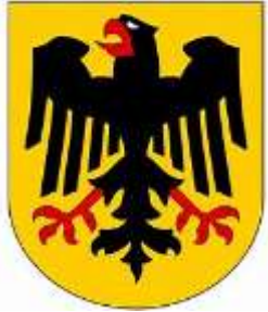
វរសញ្ញាករនៃប្រជាជាតិអាឡឺម៉ង់