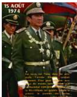
លោក លន់ នល់ ប្រធានាធិបតី នៃ សាធារណរដ្ឋ (១៩៧២-៧៥)