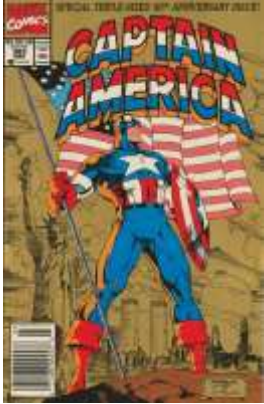
និមិត្តរូបនៃសេចក្តីស្នេហាជាតិអាមេរិច