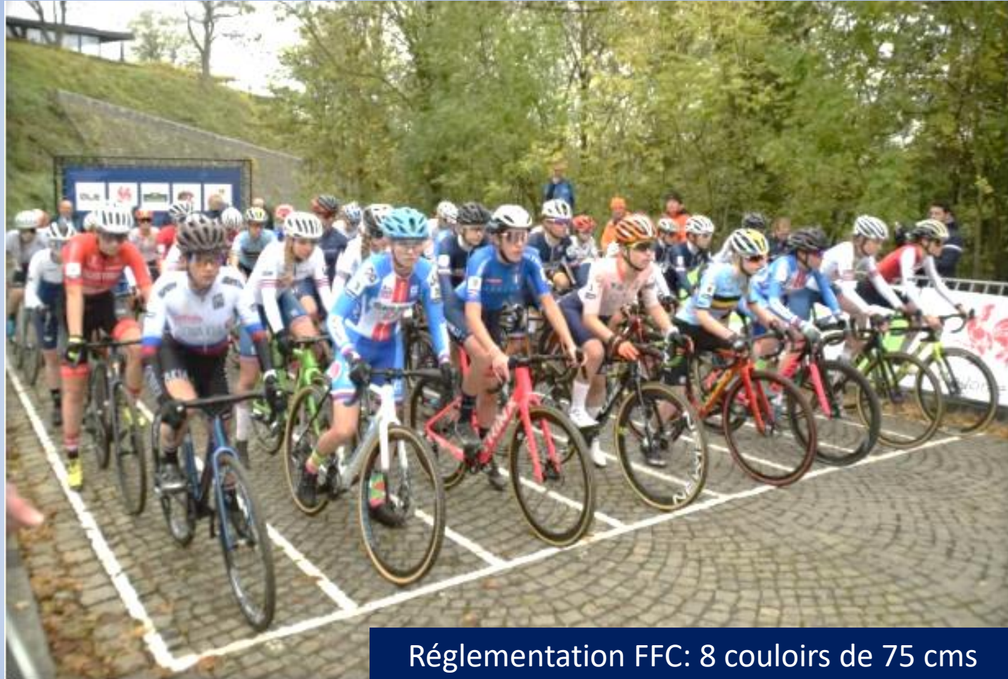
Réglementation FFC: 8 couloirs de 75 cms