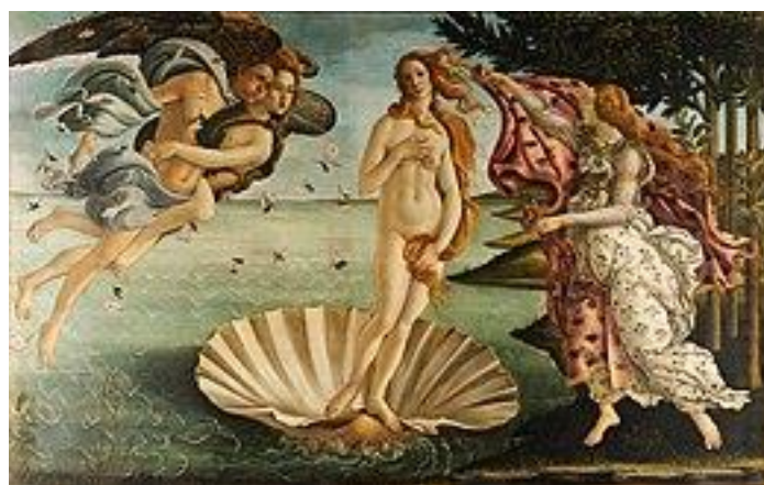
La Naissance de Vénus, Sandro Boticelli, Vers 1484-1485