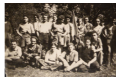
Groupe de Résistants FTP Pierre Sémard.