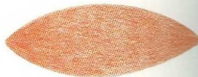
Coudre 2 morceaux ensemble.

Les ballons pour les enfants sont une bonne façon d'employer les restes de laine. Si vous n'avez que très peu de laine de chaque coloris, vous pouvez changer de couleur au milieu d'un morceau. Essayez d'employer des laines de même grosseur pour que l'échantillon reste le même.