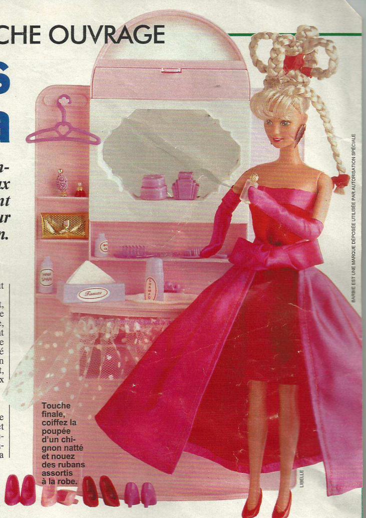
MARQUE EST UNE MARQUE DÉPOSÉE UTILISÉE PAR AUTORISATION SPÉCIALE

• La jupe. Dans le satin rose, coupez une fois la pièce n°1 pour le dos en plaçant le milieu le long de la pliure et une fois pour les deux devant. Marquez bien l'emplacement des plis. Pour la