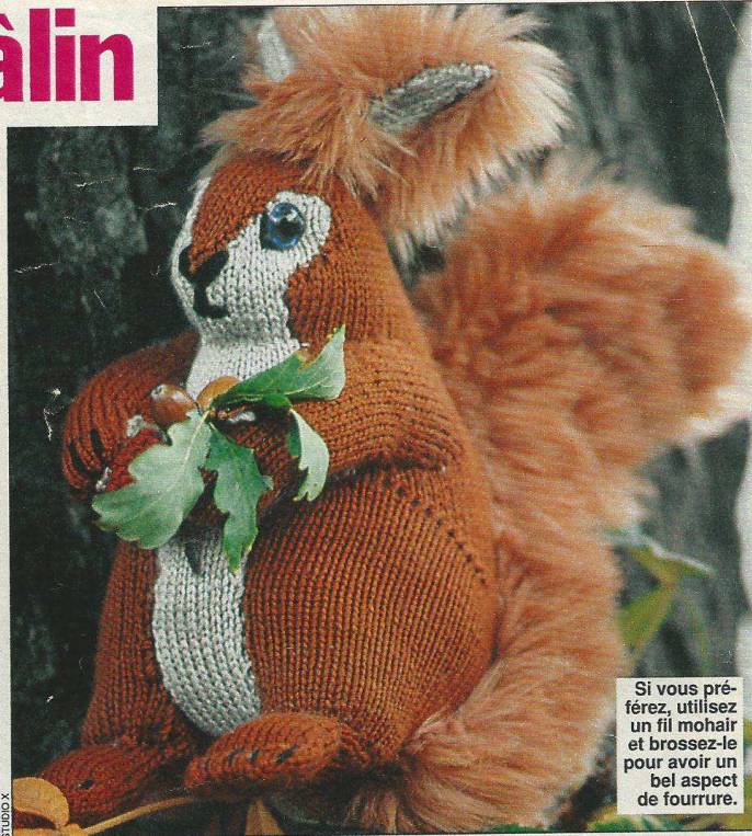
Si vous préférez, utilisez un fil mohair et brossez-le pour avoir un bel aspect de fourrure.

► Au 87 e rg, rabattez les 6 mailles restantes.