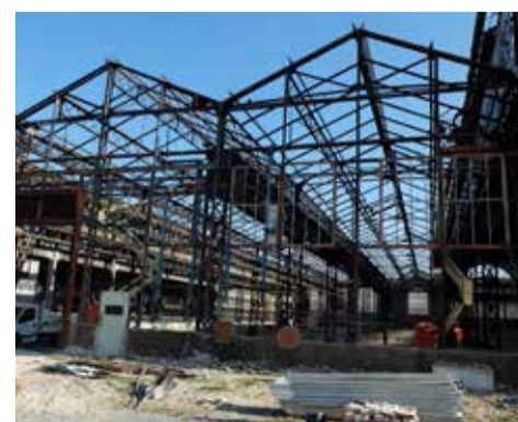
Lors des travaux de réhabilitation pour l'installation du bowling en 2014-2015