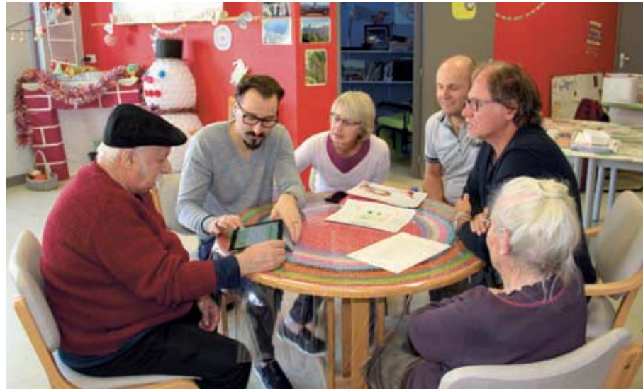
Découverte des tablettes numériques à l'accueil de jour.

foyers. Une nouveauté que les usagers attendent avec impatience. Lors du forum organisé en novembre dernier, les participants avaient fait part de leur grande envie de découvrir les nouvelles technologies. Le CCAS a fait du numérique un des axes de son développement car cela ouvre des perspectives dans l'accompagnement des personnes âgées. Le CCAS de Vierzon participe à une expérimentation et va tester des prototypes de logiciels pour le portage des repas à domicile. Les agents seront