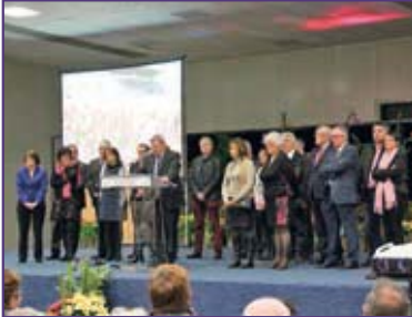
JEUDI 7 JANVIER. Vœux aux Vierzonnais dans la salle Madeleine Sologne.