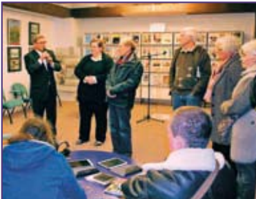
VENDREDI 22 JANVIER. Présentation des tablettes numériques et des liseuses à la médiathèque municipale.