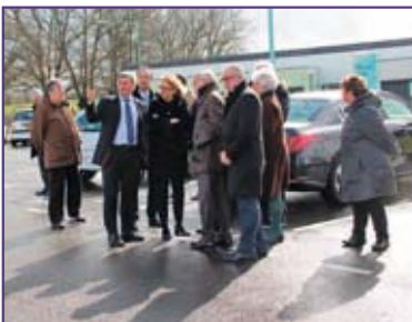
MERCREDI 2 MARS. Visite de la préfète à Vierzon, ici au Parc technologique de Sologne.