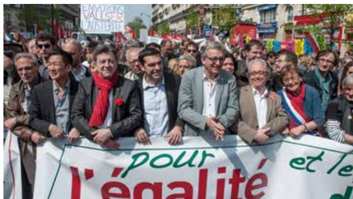
Jean-Luc Mélenchon, Alexis Tsipras et Pierre Laurent lors de la manifestation contre l'austérité du 12 avril 2014 qui a rassemblé plus de 100 000 personnes à Paris.

11 : c'est le nombre de plans d'austérité subis par la Grèce depuis 2010.