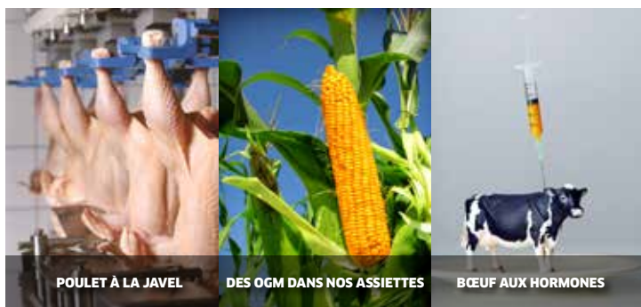
POULET À LA JAVEL