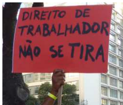
« Les droits des travailleurs ne sont pas négociables »

Manifestation pro-PT Rio de Janeiro– août 2015