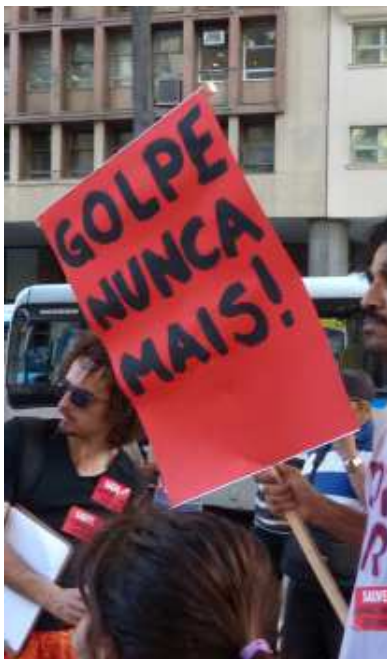
« Coup d'état plus jamais ça »