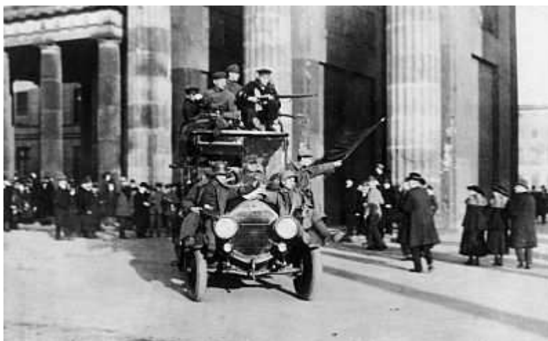
Révolution de novembre 1918 à Berlin : un groupe de soldats brandissant le drapeau rouge , le 9 novembre à la Porte de Brandebourg .

« La Ligue Spartakus se refusera à accéder au pouvoir à la place des dirigeants actuels lorsque Scheidemann-Ebert auront fait leur temps. (...) Si Spartakus s'empare du pouvoir, ce sera sous la forme de la volonté claire, indubitable, de la grande majorité des masses prolétariennes, dans toute l'Allemagne, et pas autrement que sous la forme de leur adhésion consciente aux perspectives, aux buts et aux méthodes de lutte propagées par la Ligue. (...) La victoire de Spartakus ne se situe pas au début, mais à la fin de la révolution ».