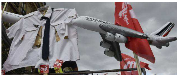
Manifestation salariés d'Air France lundi 5 octobre 2015