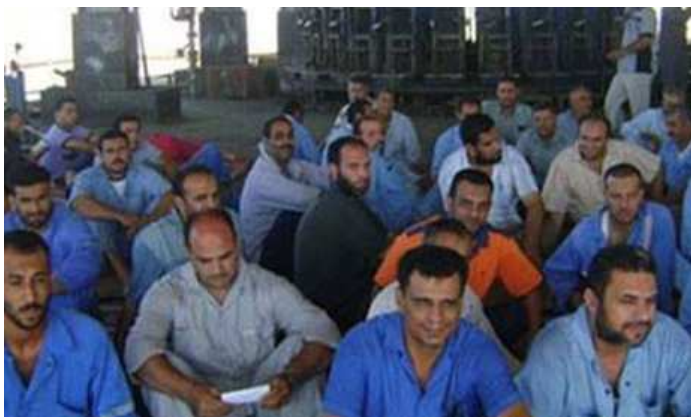
Travailleurs en grève à l'usine de textile de Mahalla – août 2013

S ur le plan politique, la conscience des masses a évolué depuis 2011, mouvement à caractère plus spontané qu'aujourd'hui. Le foisonnement politique est de mise avec une population plus politisée, plus organisée. Ce qui est à l'ordre du jour c'est une seconde vague révolutionnaire dont l'objectif serait de chasser l'Armée du pouvoir, de ses positions économiques pour instaurer le socialisme d'État par l'expropriation des moyens de production. Pour cela, il faut que les travailleurs imposent la rupture de la nouvelle centrale ouvrière avec le gouvernement mis en place par l'Armée. L'indépendance de cette centrale syndicale de l'État est un préalable essentiel. La création de cette centrale en 2011 reste cependant un acquis pour la classe ouvrière. Les travailleurs doivent imposer le Front unique ouvrier, c'est-à-dire imposer à cette centrale ouvrière et aux organisations qui se réclament de la classe ouvrière de chasser l'Armée du pouvoir. Dans ce processus, ce poserait inévitablement la nécessité de construire un Parti ouvrier révolutionnaire, seul capable de mettre en place une économie socialiste.